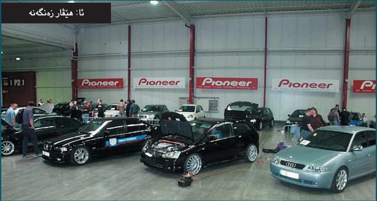
ئا: ھىقار زەنگەنە